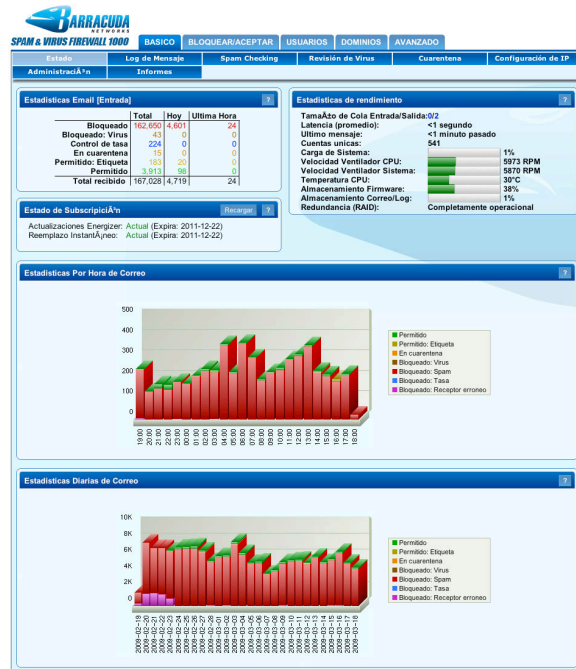
El Barracuda Spam & Virus Firewall filtra todos los mensajes de correo y muestra el número de correos electrónicos recibidos con estadísticas de como fueron procesados.

Sin software para instalar, ni modificaciones de red requeridas, el Barracuda Spam & Virus Firewall es fácil de instalar. La actualizaciones Energize son descargadas automáticamente por Barracuda Central, un centro de tecnología avanzado, donde ingenieros trabajan continuamente para proporcionar los métodos más efectivos para combatir las siempre cambiantes variantes de spam y virus. Las actualizaciones Energize, incluyendo las últimas definiciones de spam y virus y actualizaciones de seguridad, son distribuidas cada hora para protección continua contra las amenazas más recientes.